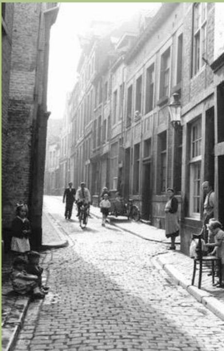
Grote Stokstraat 1951

In 1973 opende prins Claus het nieuwe Stokstraatkwartier als paradepaardje van monumentenzorg. Nu een chique winkelbuurt met veel toeristen. De oorspronkelijke bewoners keerden niet terug en de weinige mensen die er nu wonen zijn allesbehalve arm. Voor de volksbuurt moet je naar De Ravelijn.