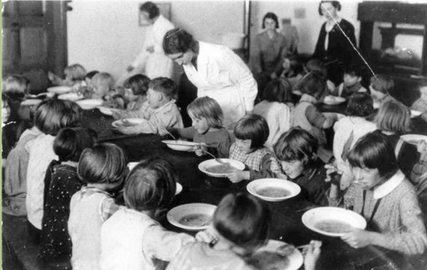
Soepbedeling door Sint Vincentius 1935 (Foto: RHCL).

We kunnen het ons nu moeilijk meer voorstellen, maar tot de invoering van de algemene Bijstandswet van 1965 waren werklozen afhankelijk van liefdadigheid. De gemeente Maastricht deed er alles aan om die liefdadigheid aan particulieren en kerken over te dragen, zodat ze niet zelf in de buidel hoefde te tasten.