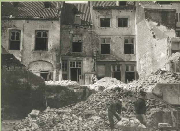
Sloop van aanbouwsels 1960 (Foto: RHCL).