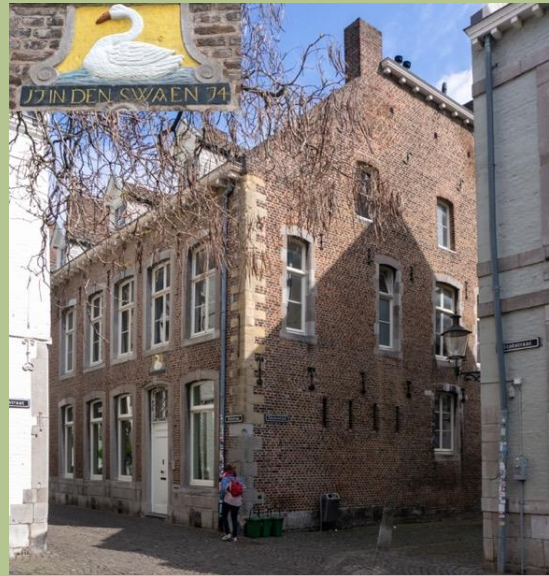
Het grote huis In den Swaen op de hoek Stokstraat – Eksterstraat (2023).

Neem het pand In den Swaen . Hoewel de gevelsteen doet vermoeden dat dit grote huis uit 1774 dateert, dateert het uit de 16 e eeuw toen er eerst een herberg en later een bierbrouwerij in zat. Bij de grote verbouwing in 1774 plaatste de nieuwe bewoner pas de gevelsteen. Toen was het Stokstraatkwartier nog een geliefde buurt voor welgestelden. In 1880 was In den Swaen een mensenpakhuis met 14 kamerwoningen. In 1918 groeide dat uit naar 20 kamers.