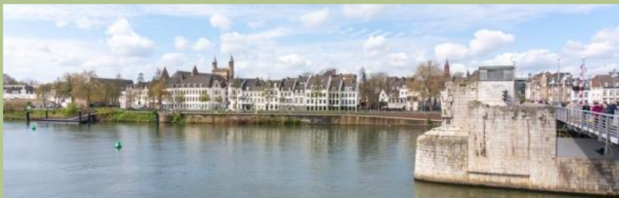
Stokstraatkwartier over de Maas, rechts de Servaasbrug.

Ten opzichte van het centrum ligt de Ravelijn, een kleine volksbuurt, wat hoger en tegen de voormalige vestingwerken aan. Je zou er zo aan voorbij kunnen lopen, totdat je de geschiedenis van dit buurtje kent, een geschiedenis die begint in het Stokstraatkwartier.