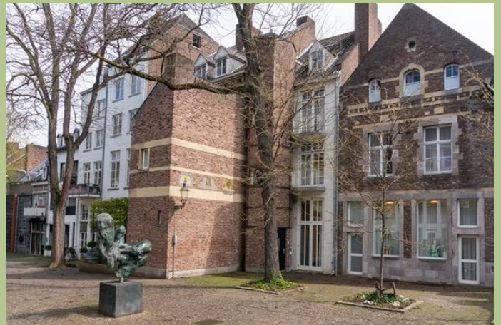
Achterzijde zonder aanbouwsels (2023).

Op de binnenterreinen en cours stonden omstreeks 1900 allerlei bouwsels; van schuurtjes, stallen, gemeenschappelijke schijthuizen en waterputten tot éénkamerwoningen. Hier ontstond een achterbuurt - een buurt achter de openbare straten - binnen een volksbuurt met veel arbeiders. Men leefde op straat tussen talloze winkeltjes en cafés. En ook kwam er veel prostitutie voor, waar met name de tijdelijke bewoners uit de logementen van genoten. Bij de sanering tussen 1957 en 1973, die vooral een restauratie bleek te zijn, verdwenen vrijwel alle bouwsels op de binnenterreinen en cours.