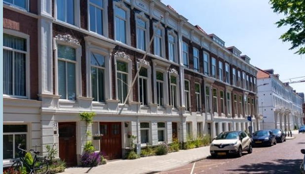
Gerestaureerde herenhuizen aan het Oranjeplein.

Die herenhuizen stonden ook aan het Oranjeplein, waarvoor de gemeente zelf een plan ontwikkelde. De Stationsbuurt was toentertijd een gemengde buurt.