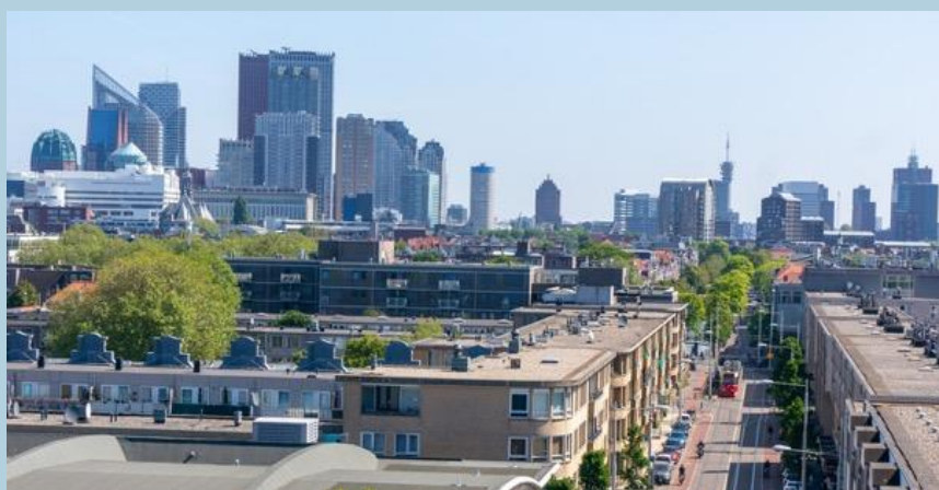
Zicht vanuit de Schilderswijk op het centrum van Den Haag.

Het slechte nieuws uit de Schilderswijk gaat meestal over armoede, criminaliteit en allochtonen die de sfeer voor autochtonen zouden verpesten. Maar als je er op een mooie dag rondloopt merk je hier niet zo veel van. De Schilderswijk is een multiculturele volkswijk, zoals er vele zijn in de wereld, met een sociaal hart en een ziel die aan een oude volksbuurt doen denken. Wat is die volksbuurtziel dan?