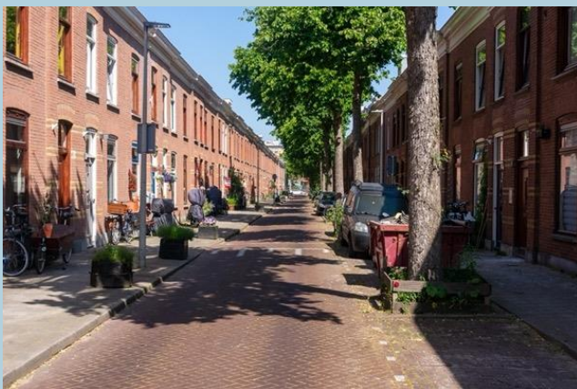
Gehandhaafde revolutiebouw in de Herderslaan.

Vanaf 1876 breidde de bebouwing zich in westelijke richting uit, waar de Schilderswijk begint. De zogenaamde revolutiebouw versnelde dat proces, waaraan de gemeente nauwelijks aan te pas kwam. Binnen de bouwblokken ontstonden hofjes met schamele optrekjes. Ongeveer in dezelfde periode bouwden verschillende charitatieve instellingen hofjes voor arme bewoners en alleenstaande vrouwen, die er nu nog steeds staan. De bemiddelde bewoners uit de Stationsbuurt waren inmiddels al vertrokken naar betere wijken. Pas in 1892 werd het bouwen van hofjes door de gemeente verboden, maar toen stond een flink deel van de Schilderswijk er al.