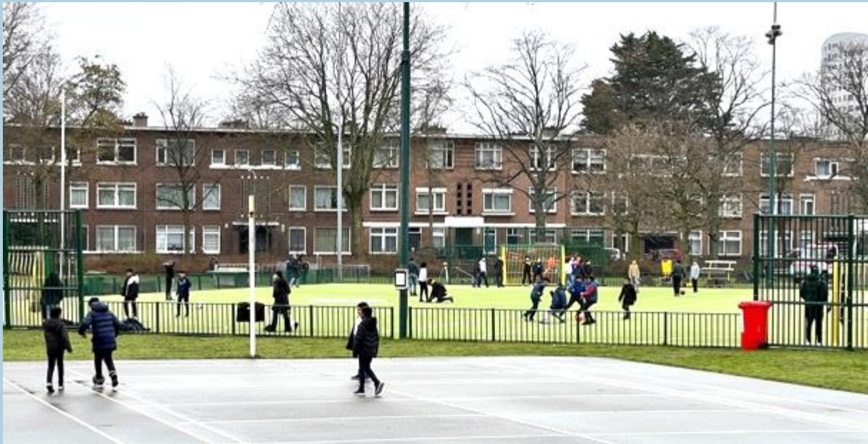
2023 spelen in het Vermeerpark dichtbij scholen.

Dat roept de vraag op waar de saamhorigheid heden ten dage uit bestaat. Door de ingrijpende stadsvernieuwing vanaf 1973 is de straat als collectieve huiskamer minder in beeld. Andere openbare en collectieve ruimtes echter des te meer, zoals: pleinen en parkjes met speelplaatsen dichtbij scholen, verschillende buurthuizen, een grote sporthal, een multicultureel theater, de Haagse markt, eethuizen, tempels, moskeeën en niet te vergeten de talloze winkels.