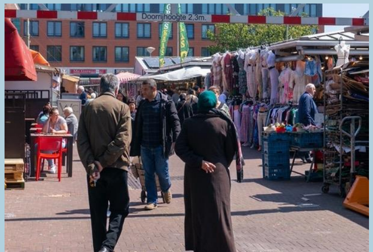
De Haagse markt.

En die treffen elkaar allemaal op de Haagse markt.