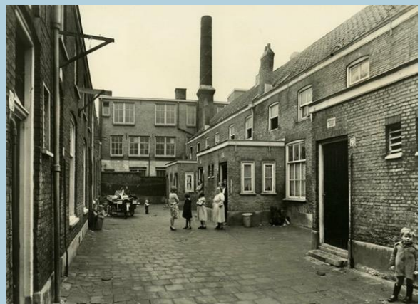
1954 Falckstraat met onbewoonbaar verklaarde woning aan de rechterzijde.