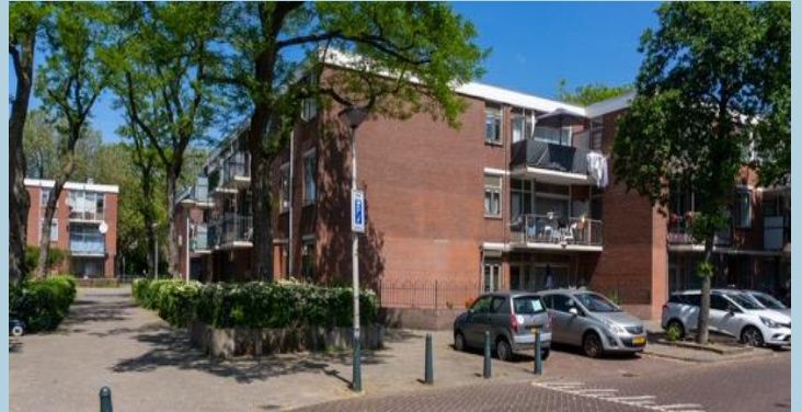
Eerste nieuwbouwplannen dichtbij het Oranjeplein.