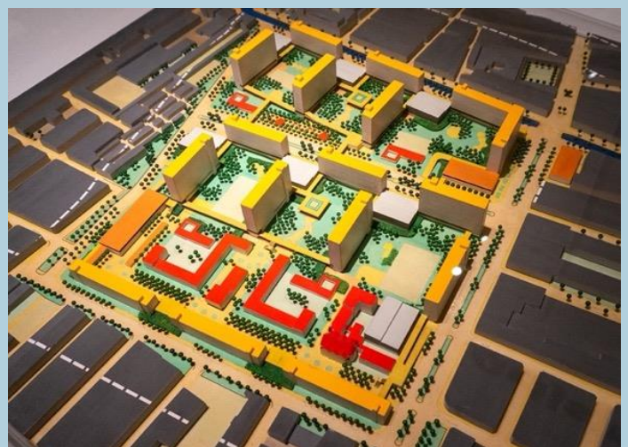
1968 plan Van Grijs naar Groen.

Toen de gemeente in 1968 met het plan 'Van Grijs naar Groen' kwam, dat uitging van grootschalige sloop en veel te hoge huren, kreeg het te maken met het buurtprotest 'Betaalbare Huren', dat een enorme vlucht nam. Toen er in 1971 een nieuwe wethouder kwam, maakte hij het uitgangspunt 'Bouwen-voor-de-buurt' tot het zijne. Dat was het begin van een zeer ingrijpende stadsvernieuwing die meer dan 30 jaar zou duren. Het merendeel van de woningen ging tegen de vlakte en het aandeel sociale woningen steeg uiteindelijk van ongeveer 6% naar 67%.