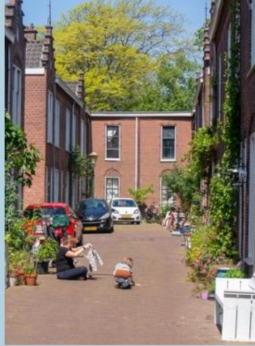
1979 Rijswijksestraat en Van Ostadewoningen 2023.

Zo fantaseren we dat in de Schilderswijk iedereen bij elkaar over de vloer kwam, maar dat blijkt in werkelijkheid niet het geval te zijn geweest. De een was wel welkom in huis, de ander niet. Saamhorigheid beperkte zich veelal tot de eigen straat of tot enkele straten. De volks buurt van een of meer straten bleek niet hetzelfde te zijn als de volks wijk , hoe graag buitenstaanders dat ook zo zien. De veronderstelde teloorgang van de saamhorigheid vormde in 1982 aanleiding voor de oprichting van een Volksbuurtmuseum. Het plaatste een uitkijktoren voor het gebouw en opende in 1993 zijn deuren. Door middel van exposities en publicaties probeerde men de geest van de oude volksbuurt op te roepen, die inmiddels danig was verkleurd. De gemeente ging hier niet in mee en stopte de subsidie na vier jaar. In het pand zit nu een multicultureel theater.