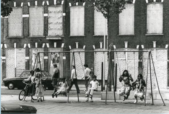
1979 Jacob van Campenplein (Foto: Dienst Stedelijke Ontwikkeling).