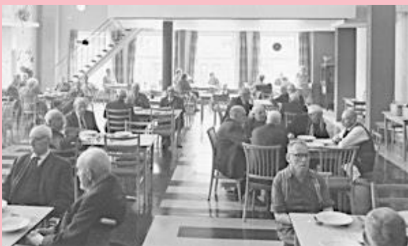
1968 Treslinghuis.