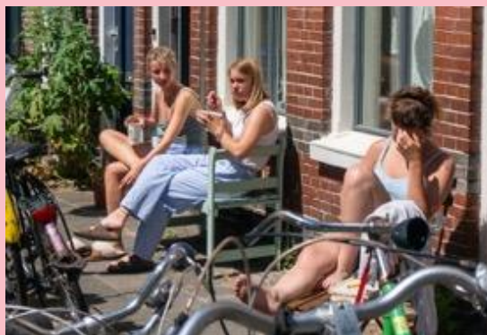
1920 Oliemulderstraat en studenten in 2023.