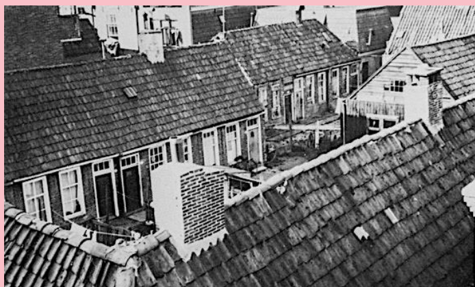
1946 volksbuurt achter de Veemarkt.

In de 19 e eeuw was Oosterpoort eigenlijk al een dorp op zichzelf. Maar ook een betrekkelijk grote volksbuurt, zeker in vergelijking met de verschillende kleine volksbuurten binnen de vestingwerken. De eerste buiten de vesting bovendien, achter de Oosterpoort, destijds een stadspoort waar de buurt naar vernoemd is. Hier vestigden zich hoveniers, scheepsjagers, schippers, timmerlui, veeboeren en arbeiders. Oosterpoort was ook een nogal gemengde wijk waar arm en rijk min of meer door elkaar woonde. Met de komst van de Veemarkt in 1892 steeg het volksbuurtgehalte. Bij het vertrek van de Veemarkt in 1969 verdween dat weer. Niet alleen bij de Veemarkt maar in heel Oosterpoort vanwege de stadsvernieuwing.