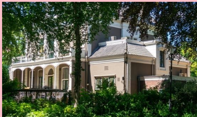
Villapark Zuiderpark, nu kantoren en onderwijs.

Een historisch buitenbeentje is het Zuiderpark (naast cultureel centrum De Oosterpoort), waar op het einde van de 19 e eeuw villa's voor de zeer rijken verrezen. Maar ook zij vertrokken naar andere woonwijken, met als gevolg dat in die riante villa's nu kantoren en onderwijsinstellingen zitten.