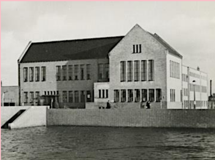
1953 Voormalig buurthuis met waslokaal aan Linnaeusplein.

Vanwege exploitatietekorten en dalend gebruik van badhuis en waslokaal - eigen douche en wasmachine waren inmiddels ingeburgerd - besloot de gemeente in 1985 het buurthuis te laten afbreken. Het voornoemde Treslinghuis functioneerde daarna even als buurthuis, totdat ook dat in 2018 werd afgebroken.