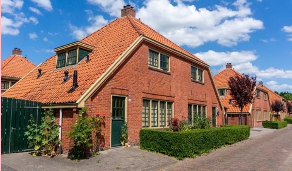
Het gerenoveerde Blauwe Dorp in 2023.

iets later, in 1922, bouwde de socialistische arbeiderscorporatie de Gorechtwijk, tussen het ziekenhuis en het nieuwe uitbreidingsplan waar het arbeidersparadijs zou gloriëren. Eigenlijk kun je de Gorechtwijk als voorbeeldwijk zien van het nog te bouwen arbeidersparadijs. Hier werd overduidelijk niet voor de allerarmsten gekozen. Inmiddels zijn de meeste woningen van de Gorechtwijk aan particulieren verkocht. De populaire Amsterdamse School architectuur van deze buurt heeft daar ongetwijfeld aan bijgedragen.