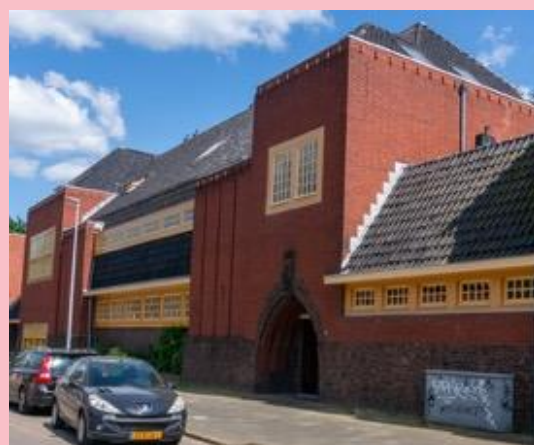
Het socialistische 'arbeidersparadijs' de Gorechtbuurt in 2023.