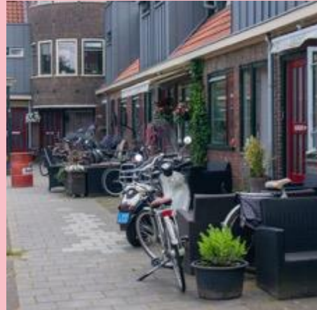
Impressies uit het Witte Dorp in 2023.

Vervolgens moest de rest van het uitbreidingsplan nog gebouwd worden.