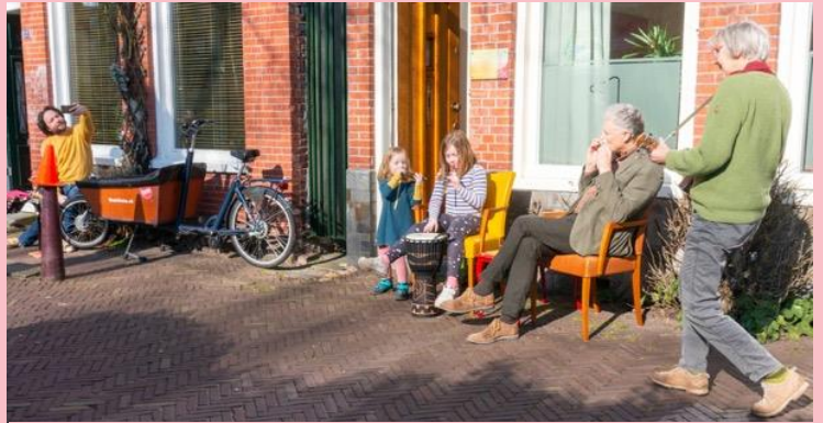
2023 Niet alle gezinnen zijn verdwenen.

Eigenlijk startte dat proces al voor het vertrek van de Veemarkt. In 1960 vertrokken jonge gezinnen uit Oosterpoort naar nieuwbouwwijken elders, simpelweg omdat er toen veel nieuwe, ruime sociale woningen beschikbaar kwamen. In tien jaar tijd nam het aantal kinderen in Oosterpoort daardoor drastisch af en verdubbelde het aantal jongeren tussen 15 en 25 jaar, vooral studenten die voor weinig geld in een slecht onderhouden pand terecht konden. Het merendeel van de huizen was toen nog in particuliere handen.