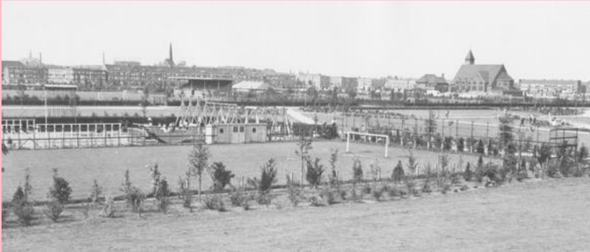
1952 voetbalstadion

Ook het eerste buurthuis van Groningen – van heel Nederland wordt zelfs gezegd - uit 1937 droeg bij aan de saamhorigheid. Het was niet alleen bedoeld om er te kaarten of een borrel te drinken, maar ook om de was te doen, jezelf te wassen, toneel te spelen, een boek te lenen of een vak te leren. Volksverheffing stond centraal, dat hoort nu eenmaal bij een arbeidersparadijs.