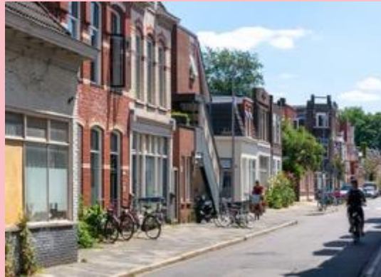
1910 Oosterweg en nu vanaf dezelfde plek in 2023.

Oosterpoort is nu een stadswijk waar veel studenten in een dorpsachtige sfeer wonen.