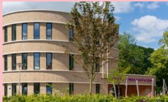
2023 Integraal Kindcentrum.

Maar voor het zover was, verrees in 1919 een tuindorp met 176 woningen in vier onder één kap ‘boerderijtjes’, het zogenaamde Blauwe Dorp, vlakbij het in 1900 gestichte slachthuis. Die naam kreeg het vanwege de afwezigheid van een café of slijterij. De gemeente vond alcohol drinken ongewenst (denk aan vereniging De Blauwe Knoop). Vaak wordt beweerd dat dit buurtje bedoeld was voor de allerarmsten, maar in werkelijkheid woonden er verschillende beroepsgroepen die de huur goed konden betalen. Dit buurtje is niet - zoals het Rode Dorp - afgebroken, maar gerenoveerd.