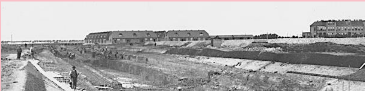
1919 Rode Dorp links en Treslinghuis rechts.

Met name deze twee projecten, het Treslinghuis en het Rode Dorp, droegen bij aan het volksbuurtkarakter van het nog te bouwen ‘arbeidersparadijs’ van het uitbreidingsplan uit 1928, toen Plan Oost geheten. Alle nieuwe woonwijken zouden moeten bijdragen aan dit ideaalbeeld.