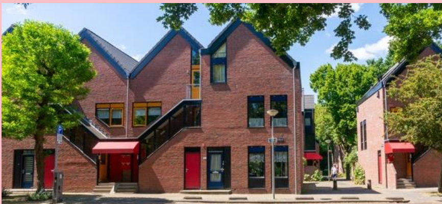
2023 sociale woningen op de plek van het voormalige volksbuurtje.

Er kwamen weliswaar nieuwe sociale woningen voor in de plaats, maar een volksbuurt werd het niet meer. De hele Oosterpoort bevond zich toen in een spiraal van stadsvernieuwing, met mondige bewoners die niet meer over zich heen lieten lopen. Woningen werden opgeknapt, her en der gesloopt voor nieuwe sociale woningen en ook koopwoningen kwamen er. Heel Oosterpoort begon er beter uit te zien, met behoud van zijn intieme dorpse karakter.