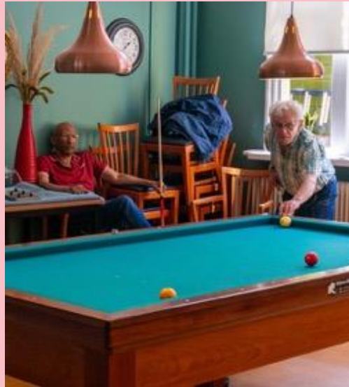
Buurtcentrum Poortershoes in Oosterpoortbuurt.

De rellen van 30 december 1997 in de Oosterparkwijk staan daarentegen bij menigeen nog in het geheugen gegrift. Een groep ontevreden jongeren gooide ramen in, zaagde bomen om en stichtte brand. Volwassen buurtbewoners grepen niet in en de politie ook niet. De Oosterparkwijk stond toen bekend als probleemwijk – vaak synoniem voor volksbuurt - met veel werkloze jongeren die van voetbal houden. Het stadion van FC Groningen, dat midden in hun wijk stond, trok veel voetbalvandalen. Dit heeft - al dan niet doorslaggevend - meegespeeld in de beslissing van het gemeentebestuur om het nieuwe grote voetbalstadion aan de rand van de stad te bouwen.