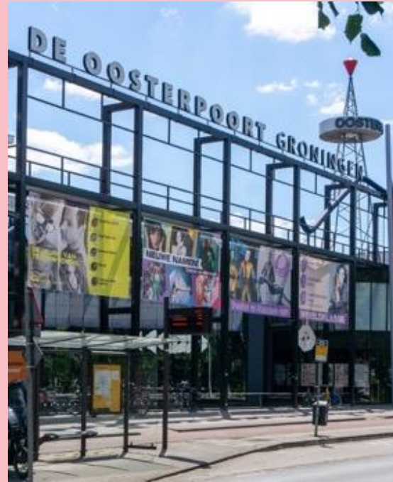
1925-1930 Veemarkt en De Oosterpoort in 2023.

Er kwamen weliswaar nieuwe sociale woningen voor in de plaats, maar een volksbuurt werd het niet meer. De hele Oosterpoort bevond zich toen in een spiraal van stadsvernieuwing, met mondige bewoners die niet meer over zich heen lieten lopen. Woningen werden opgeknapt, her en der gesloopt voor nieuwe sociale woningen en ook koopwoningen kwamen er. Heel Oosterpoort begon er beter uit te zien, met behoud van zijn intieme dorpse karakter.