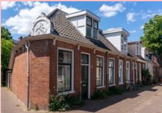
Van oudsher, arm en rijk door elkaar...

Van oudsher woonden hier arm en rijk door elkaar in een mengelmooie van krotten, herenhuizen, sociale huurwoningen en particuliere huizen. Deze variatie aan huizen is nog steeds groot, maar de variatie aan bewoners lijkt steeds kleiner te worden.