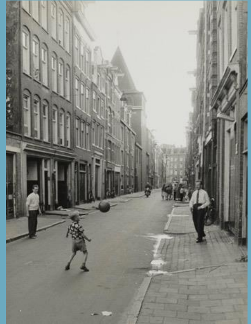
Bloemstraat 1958

Hoewel het verschijnsel van de straat als huiskamer doet vermoeden dat saamhorigheid ook inhield dat iedereen bij elkaar over de vloer kwam, bleek dat in werkelijkheid zelden het geval te zijn. De een was welkom, de ander niet. Saamhorigheid beperkte zich vaak tot de eigen portiek, eigen straat of tot enkele straten, maar het is onmiskenbaar waar dat alle bewoners samen trots waren op de Jordaan. De Jordaan werd een geuzennaam die Johnny Jordaan en zijn vrienden aan de bewoners gaven. Zij maakten ook onderscheid in Jordaners, zij die in de Jordaan wonen, en Jordanezen, de geboren en getogen Jordaners.