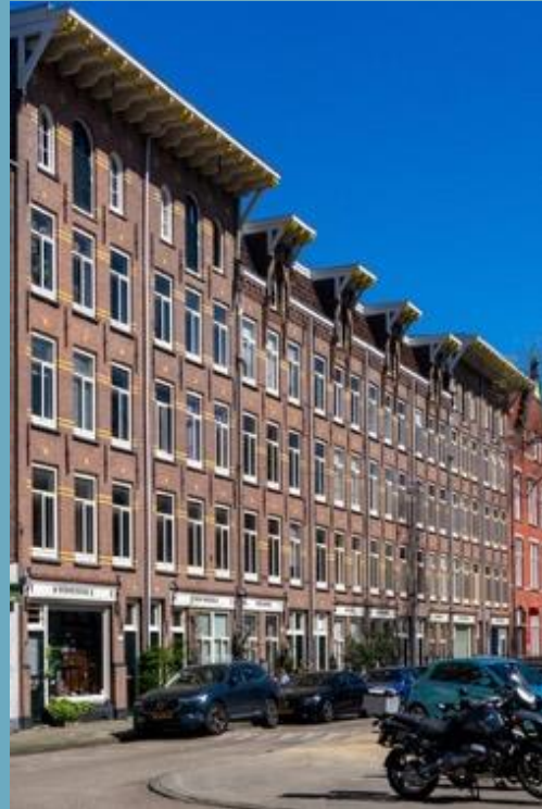
1895 tussen Goudsbloemstraat en Lindengracht en nieuwbouw aan de Lindengracht uit 1896.

De Jordaan was door zijn armoedige bebouwing, zijn reputatie als volkswijk en zijn ligging tussen Prinsengracht en Singel lange tijd een geïsoleerde wijk. De wijk was berucht om zijn natte kelderwoningen met bedsteden, zijn sloppen en doodlopende stegen (gangen) en het gebrek aan lucht en licht in de woningen.