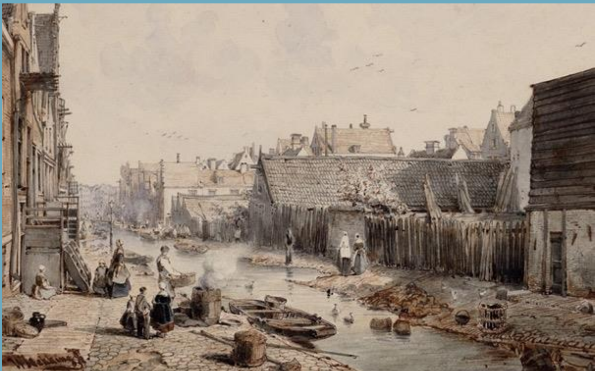
Goudsbloemgracht voor de demping in 1854 door Willem Hekking, nu Willemsstraat.

Die armoedige situatie bleef lang bestaan. Cholera- en tyfusedemieën braken regelmatig uit. De grachten, die zowel voor drinkwater zorgden als riool waren, stonken enorm. Voor de gemeente was dat aanleiding om in de tweede helft van de 19 e eeuw enkele grachten te dempen en een begin te maken met de aanleg van waterleidingen en riolering.