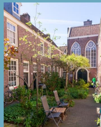
Zeven Keurvorsten hofje.

Al in de 17 e eeuw wilden weldoeners en liefdadigheidsinstellingen iets doen aan de grote armoede in de Jordaan. Ze legden daarom hofjes aan voor arme alleenstaanden. Nog steeds bestaan deze naar binnen gekeerde werelden, nu veelal als sociale woningbouw.