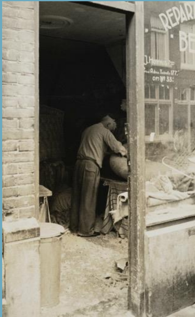
Beddenmaker circa 1950.