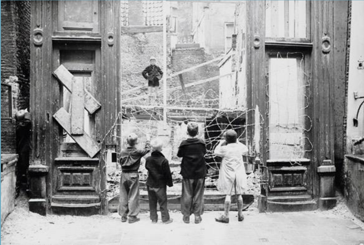
1955 Nieuwe Leliestraat (foto: dpgmedia).

In 1950 nam de gemeente een voorbereidingsbesluit dat bouwen in de Jordaan verbod vanwege een saneringsplan dat in de maak was. Sanering, afgeleid van het woord 'sanitas' = gezondheid, betekende in die dagen overigens gewoon slopen.