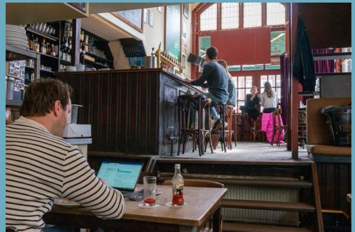
Werken en eten in een bruine kroeg.

De bruine kroeg hoort eigenlijk ook bij de straat, als een soort huiskamer. Deze dreigt nu te verdwijnen, en daar zijn verschillende oorzaken voor. De afname van het aantal Jordanezen speelt daar geen onbelangrijke rol in. De nieuwe Jordaners spreken meer Engels dan plat Amsterdams, ze eten vele soorten gezond brood en ze drinken malle koffies. Graag zouden ze in een bruine kroeg niet alleen wat willen drinken maar ook werken en eten. Helaas serveert een klassieke bruine kroeg alleen bitterballen, kaas en olijven.