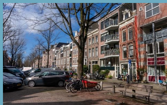
Lindengracht 2023 met afwisseling tussen oude en nieuwe huizen.

We duiken verder de geschiedenis in om bovenstaande veranderingen beter te begrijpen. Als je nu bijvoorbeeld over de Lindengracht loopt zie je een parkeerstrook in het midden, waar ooit water door een gracht stroomde. Er staan geen krotten meer. Oude en nieuwe huizen staan keurig naast elkaar.