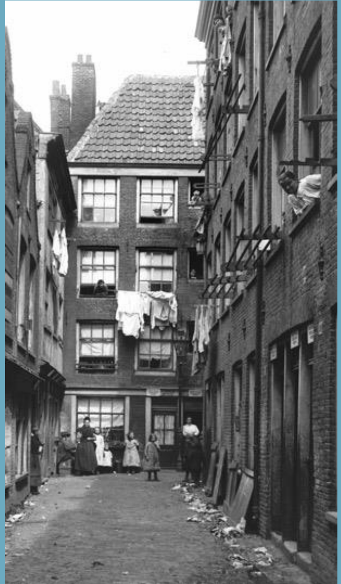
Wijdegang circa 1910 (Foto's: stadsarchief Amsterdam).

Omstreeks 1890 woonden er in de Jordaan ongeveer 82.000 mensen. Meer zouden het er niet worden. In veertig jaar tijd liep het inwonertal terug tot ongeveer 50.000. Dat had vooral te maken met de slechte woonomstandigheden. Zo reed er tot aan de Eerste Wereldoorlog, bij gebrek aan riolering, nog een Boldootwagen rond, waarin poeptonnen geleegd werden. Het dalende inwonertal was ook het gevolg van de Woningwet van 1901. Die leidde tot de bouw van ruimere arbeiderswoningen in andere stadsdelen, die daardoor meer in trek raakten. Tussen de Eerste en Tweede Wereldoorlog sloopte de gemeente de ergste sloppen, gangen, forten en bouwsels op binnenterreinen, zonder de structuur van de lange en smalle bouwblokken aan te passen. Sanering werd dat genoemd, al haalde dat weinig uit want de verkrotting ging gewoon door. Nieuwbouw vond er namelijk niet plaats. In de panden van de vertrekkende bewoners trokken simpelweg andere arme mensen. Of ze werden onbewoonbaar verklaard dan wel als bedrijfsruimte verhuurd. Op deze behoorlijk lange periode zonder noemenswaardig ingrijpen van de overheid volgde de hongerwinter van 1944. In dat jaar werd uit veel leegstaande panden hout geroofd dat werd gebruikt als brandstof. De Jordaan begon er nog slechter uit te zien. Na de Tweede Wereldoorlog liep het inwonertal verder terug tot bijna 40.000.