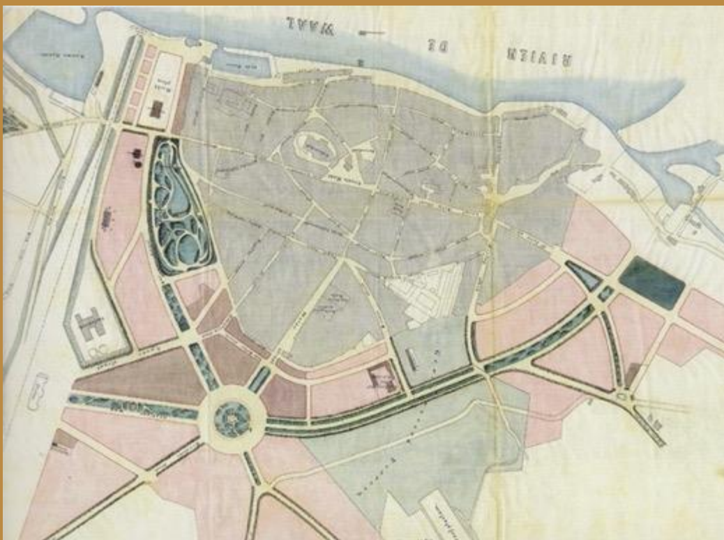
1888 Uitleg van de stad (bron: RAN)

Na het aannemen van de vestingwet in 1874, brak men de vestingwallen af. Nijmegen kon eindelijk uitbreiden en deed dat na een tijdje dan ook.