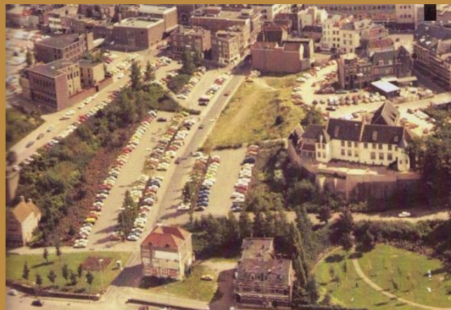
Grotestraat e.o. in 1975: veranderd in één lange parkeerplaats