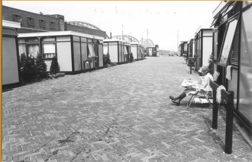
1977 Tijdelijke woningen voor de bewoners aan de Veemarkt.