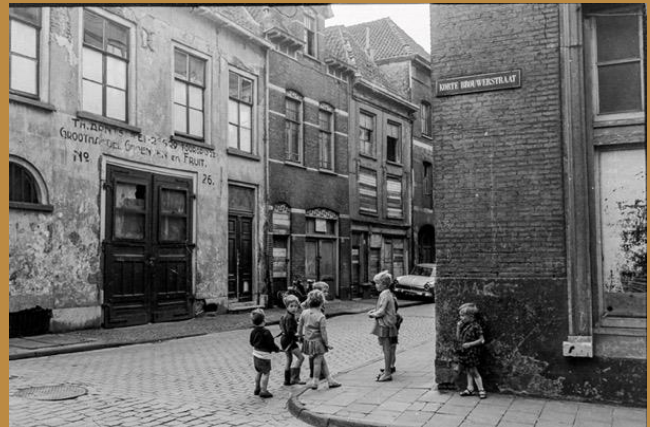
Spelen tussen de slooppanden in 1969.

Dat resulteerde tussen 1978-1985 in een nieuwbouwplan met veel woningwoningen in baksteen met dakpannen, dat zich voegde in het middeleeuwse stratenpatroon. En hoewel een deel van de oorspronkelijke bebouwing toch nog werd gesloopt, kreeg men het voor elkaar om een middeleeuws sfeertje te creëren. De oorspronkelijke bewoners (voor zover nog aanwezig) mochten met voorrang terugkeren.