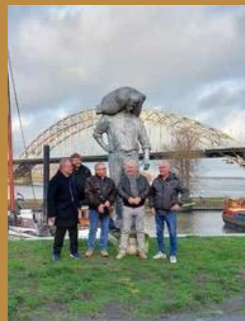
Kaaisjouters en kleinzonen bij het beeld De Kaaisjouwer

Terwijl veel vrouwen uit de Benedenstad in de 19 e eeuw werkten als dienstmeisje bij de gegoede burgers in de wijk, vonden vrouwen uit latere generaties steeds meer emplot in de horeca, prostitutie en onderbetaald werk. Deze economische achterstelling ging gepaard met hulpverlening van bovenaf door vooral de kerk en de kloosters. Dit ging door tot in het midden van de 20 ste eeuw toen de overheid met zijn sociale voorzieningen het stokje overnam.