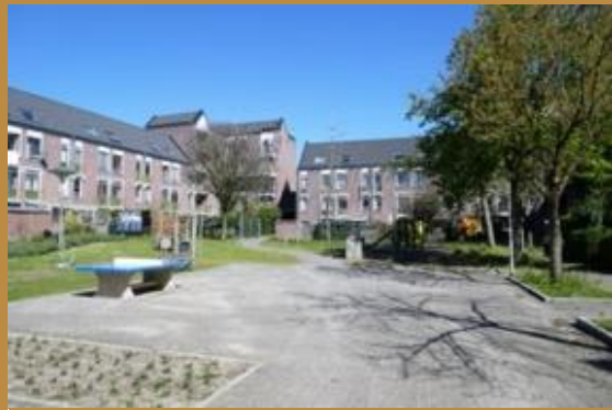
2023 Speelvoorziening in Kartuizerhof.

Op deze binnenterreinen kunnen de bewoners van hun saamhorigheid genieten, al wordt deze soms op de proef gesteld. Zo is de situatie overdag in het Kartuizerhof (zie foto hierboven) vredig en haast dorpsachtig, maar tegen de avond komt er wel eens drugs- en prostitutieoverlast voor.