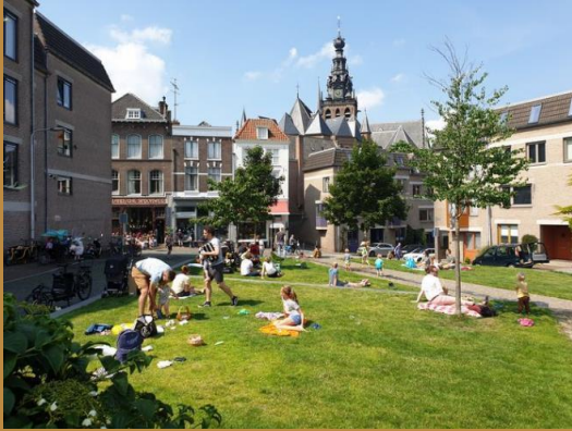
2019 Chillen op de Korenmarkt.