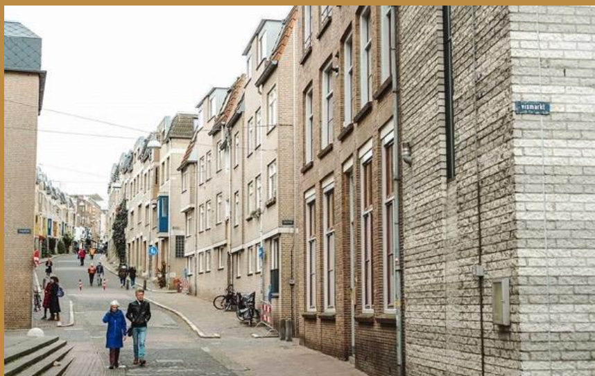
Grotestraat: 20 meter omhoog vanaf de Waal.

Die heuvels ontstonden in lang vervlogen tijden door de ijsmassa's die vanuit Scandinavië Nederland bedekten en enorme zandmassa's voor zich uitschoven. Het grootste deel van de Benedenstad ligt aan de voet van die heuvels; aan de westzijde van de wijk vlakken de heuvels af en is nauwelijks nog sprake van hoogteverschillen.