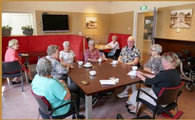
Bewoners in het wijkcentrum Het Oude Weeshuis tijdens het “soepje”.

De meeste bewoners hebben het niet over een “volksbuurt” als ze over de Benedenstad spreken. Wel zijn er velen actief om de leefbaarheid van de wijk op peil te houden.