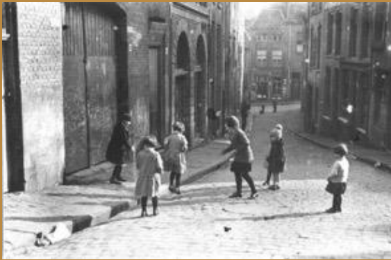
1938 Spelen in de Vleeshouwerstraat (foto: RAN).

Het “klassieke straatleven” is grotendeels verdwenen. Dat heeft zich deels verplaatst naar de binnenterreinen aan de achterkant. Ook het ouderwetse bureaucontact veranderde door maatschappelijke ontwikkelingen.