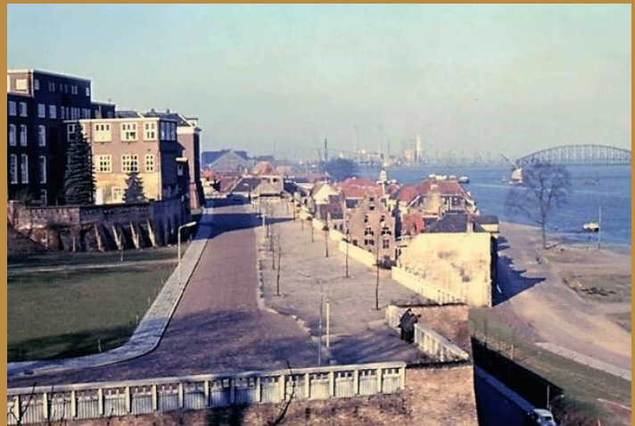
Groene Balkon in 1959.

Omdat na de oorlog de prioriteit van het gemeentebestuur bij de wederopbouw van de Bovenstad lag, zette het verval van de Benedenstad door. Dat resulteerde in een afname van de bevolking van 10.000 aan het begin van de 20 e eeuw tot circa 1.000. Halverwege de jaren vijftig keurde Bouw- en Woningtoezicht bovendien de helft van de woningen af. Het verval leidde tot verdere sloop. Het gemeentebestuur zat met deze uitgedunde volksbuurt duidelijk in zijn maag. Ze bestempelde de bewoners zelfs als "onmaatschappelijken" die verplaatst moesten worden.