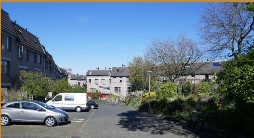
Parkeren, groen en spelen op het Johannieterhof

De smalle straatjes boden natuurlijk niet voldoende ruimte voor parkeerplaatsen en speelplekken. Dat noopte tot creatieve oplossingen: behalve twee parkeergarages kwamen er voorzieningen voor spelen en parkeren op de binnenhoven aan de achterzijde van de woningen. De meeste van deze hoven zijn nog steeds openbaar toegankelijk; je kan je op deze rustige plekken haast niet voorstellen dat je in het stadshart van Nijmegen bent. Met name in het oostelijk deel van de wijk zorgen de hoogteverschillen bovendien voor verrassende doorkijkjes.